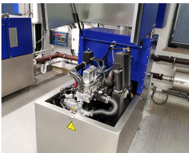
Im BHKW steckt ein Motor, der mit einem Generator zur Stromerzeugung gekoppelt ist: Die Abwärme wird als Nebenprodukt in Strom umgewandelt.