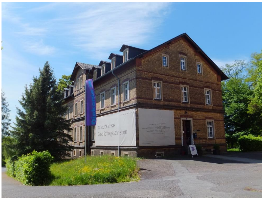
Gebäude 15a, Kunst + Museumsprojekt Zschadraß „Ort jenseits der Straße“

Die Diakoniewerk Zschadraß gGmbH, ein Unternehmen der Diakoniestiftung in Sachsen, betreibt in Zschadraß bei Colditz ein Fachkrankenhaus für Psychiatrie und Psychotherapie sowie Neurologie mit insgesamt 150 Betten und 60 Tagesklinikplätzen und einer Psychiatrischen Institutsambulanz (PIA), ein Seniorenpflegeheim und ein Wohnheim für Menschen mit Behinderung.